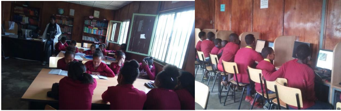
ተማሪዎች በእንቡጥ ማኅበር መጽሐፍት ቤት