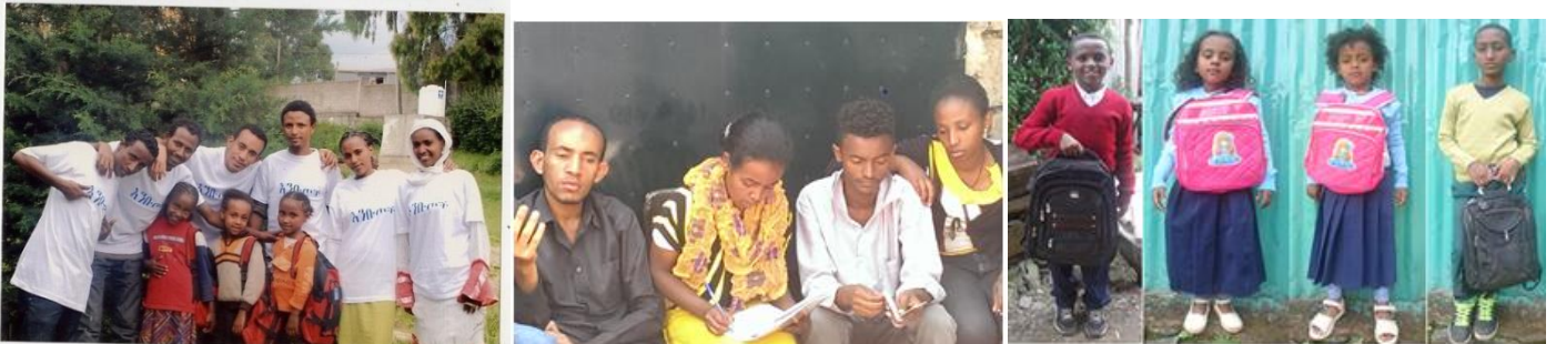
ተረጂ ሕጻናትና የክለቡ አባላት በከፊል

አንጋፋ ተማሪዎች በተለያዩ ምክንያቶች ተበታትነው እንዳይቀሩ የመረዳጃ ክብብ ፈጥረንላቸው ፣ በአሁን ወቅት በችግራቸው ጊዜ በመገናኘት እርስ በርሳቸው በመረዳዳት ላይ ይገኛሉ ። ከራሳቸውም አልፎ ረዳት ለሚያስፈልጋቸው ፣ ለ 4 ሕጻን ተማሪዎች በራሳቸው አነሳሽነት ፣ የዓመት ሙሉ የትምህርት ትጥቃቸውን አሟልተውላቸው በኩራት ወደ ት/ቤት እንዲሄዱ አድርገዋል ። እንግዲህ የእንቡጥን ፋና የመከተል ፍንጭ ስላሳዩን የልጅ ልጅ እንዳየን ያህል ስለተሰማን በደስታ ኩራት ፣ ተሞልተናል ። በዚህ እንደሚቀጥሉም ጽኑ ምኞታችን ነው !!