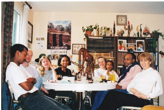
የእንቡጥ ማኅበር ጠንሳሾች በክፍል

ባጭሩ ማኅበሩን ስንመሠርት ወደ 10 የምንሆን ጓደኞቻችን ነበርን ፣ ከዚያ ቀስ በቀስ ቁጥራችን በዝቶ በአሁኑ ወቅት የቢሮ አባላት ከቴክኒክ አማካሪዎች ጋር 13 ስንሆን ወደ 80 የሚጠጉ ማኅበራዊ ተቋማትም አሉን ።