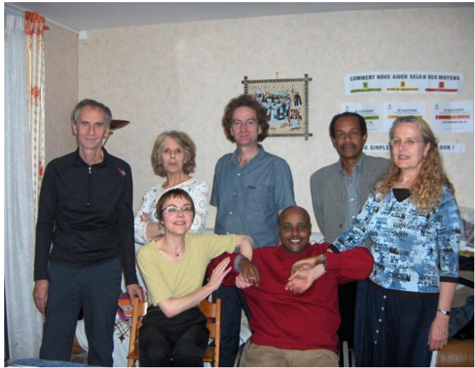
የቢሮ አባላት በከፊል