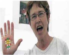
ጅምር ሥራችንን ይቀጥላል .....